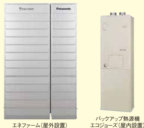
エネファーム(屋外設置) バックアップ熱源機 エコジョーズ(屋内設置)

ご家庭の1日の生活パターンを学習し最適に発電! 普段通りに暮らすだけで、「もっともエコ」を実現します。