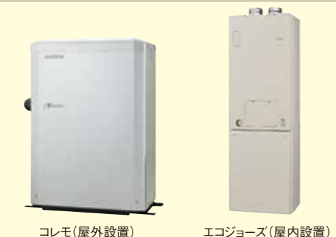
コレモ(屋外設置) エコジョーズ(屋内設置)