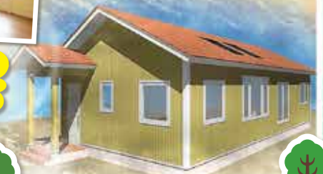
※イラスト・写真はイメージです。